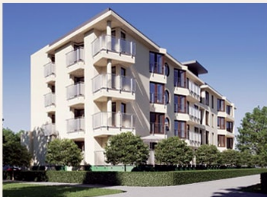
GRODZISK MAZOWIECKI - KOPERNIKA 18A